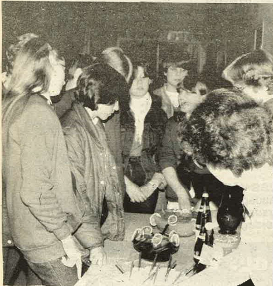
Dei alkoholfrie drinkane var både gode og populære.

servert svært velsmakande prøver på alkoholfrie drinkar, og desse fall og tydeleg i smak. Mat og kaffi var å få kjøpt, og så kunne både unge og vaksne svinge seg i dansen til discemusikk. Fram mot 100 fekk seg ein hyggeleg laurdagskveld. Og tiltaket bør så absolutt takast opp att.